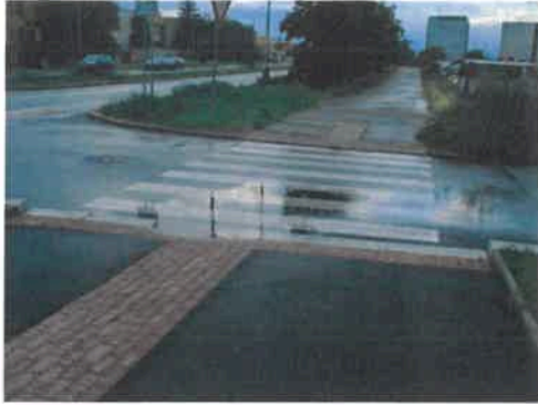
Obrázek 1: Přejechení křižovatka Novodvorská x Zbudovská po dešti