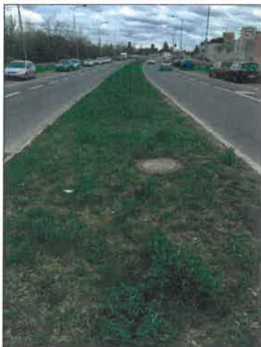
Obrázek 3: Foto středového pruhu - pohled směr Pavlíkova